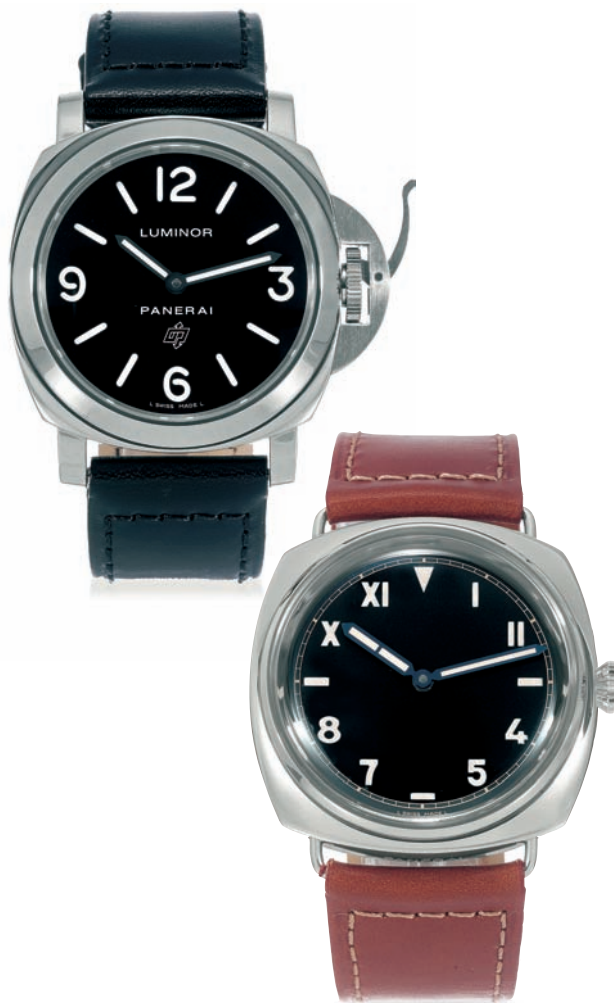
DALL'ALTO: PANERAI LUMINOR LOGO REF PAM00 PANERAI 1936 REF PAM249