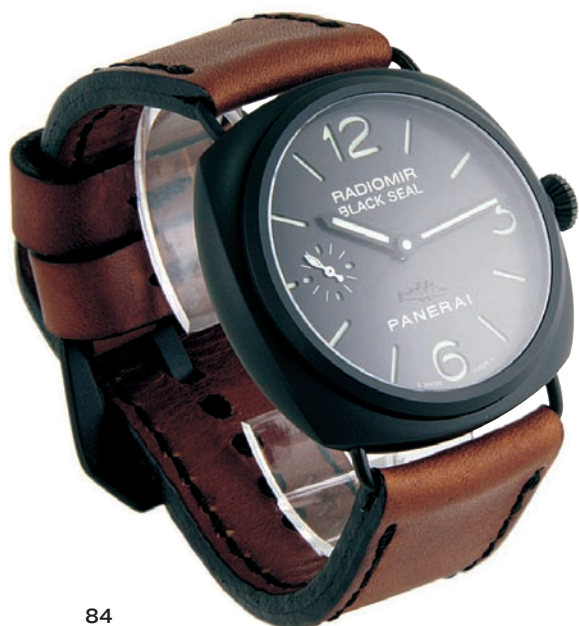
PANERAI RADIOMIR BLACK SEAL REF PAM292