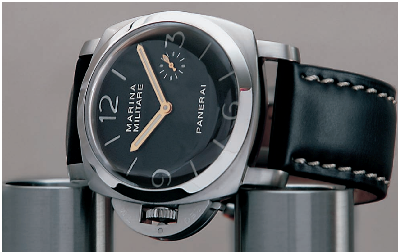
PANERAI MARINA MILITARE REF PAM217MM1000