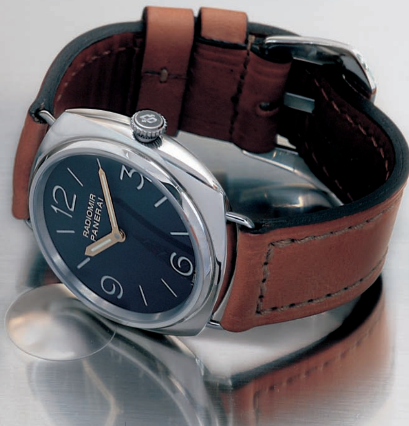
PANERAI RADIOMIR REF PAM232