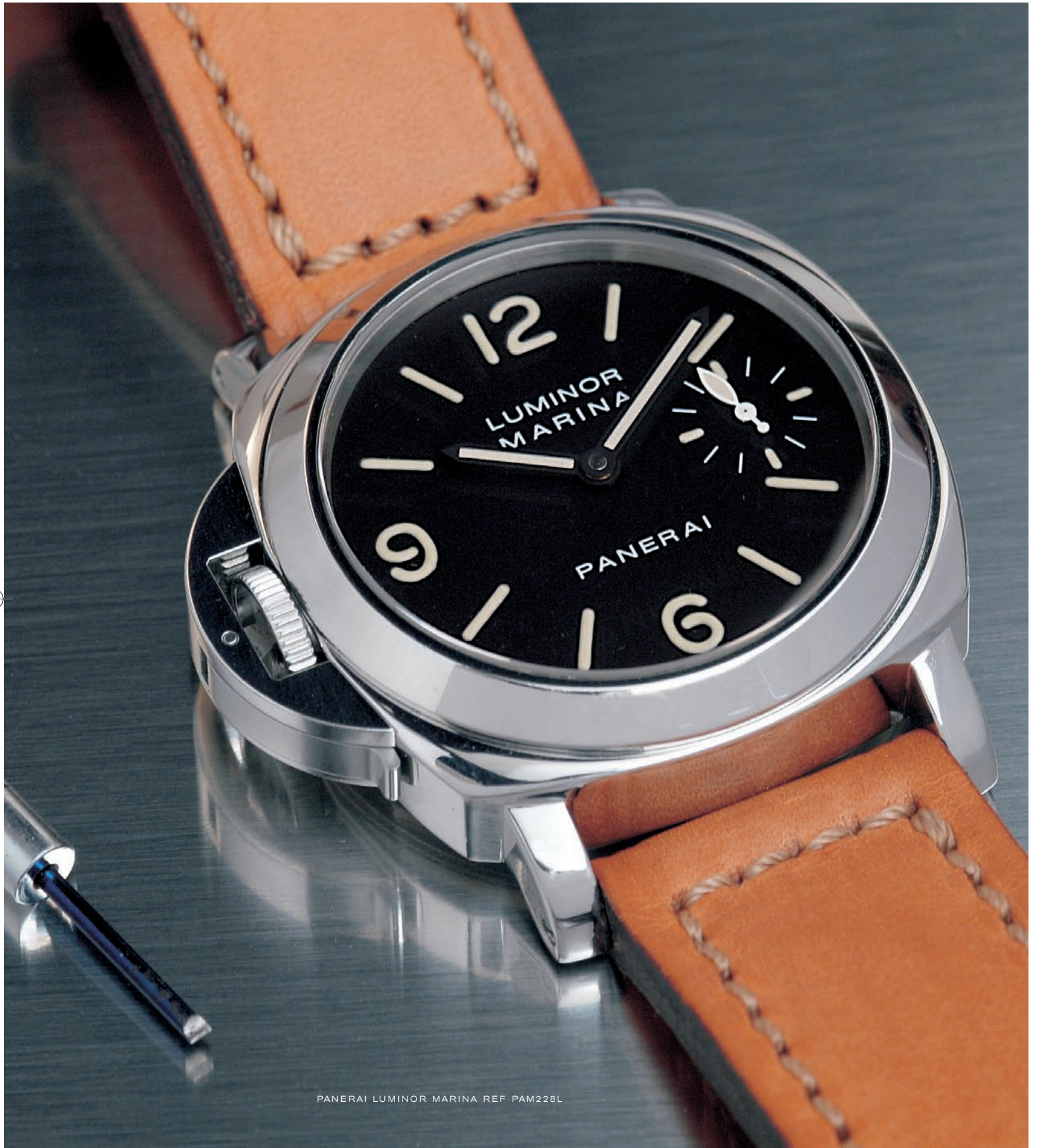
PANERAI LUMINOR MARINA REF PAM228L