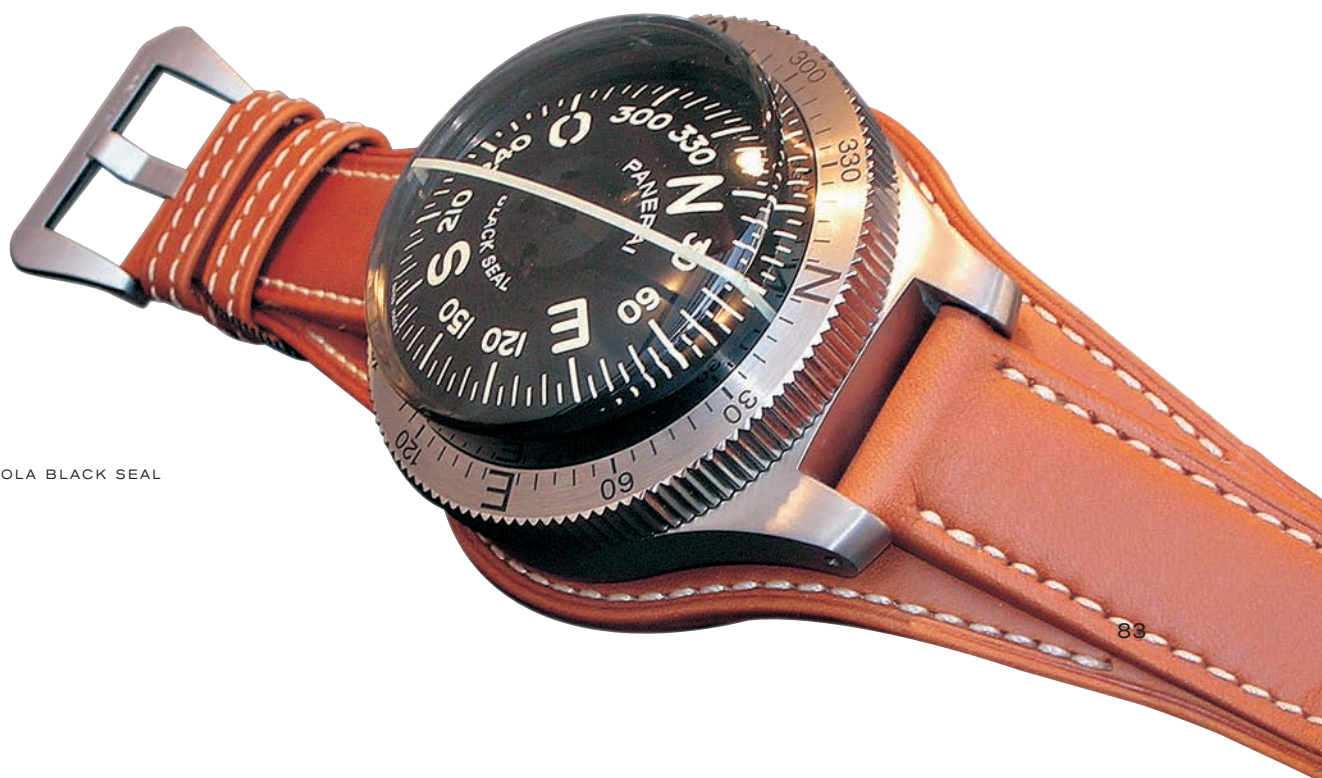
PANERAI BUSSOLA BLACK SEAL