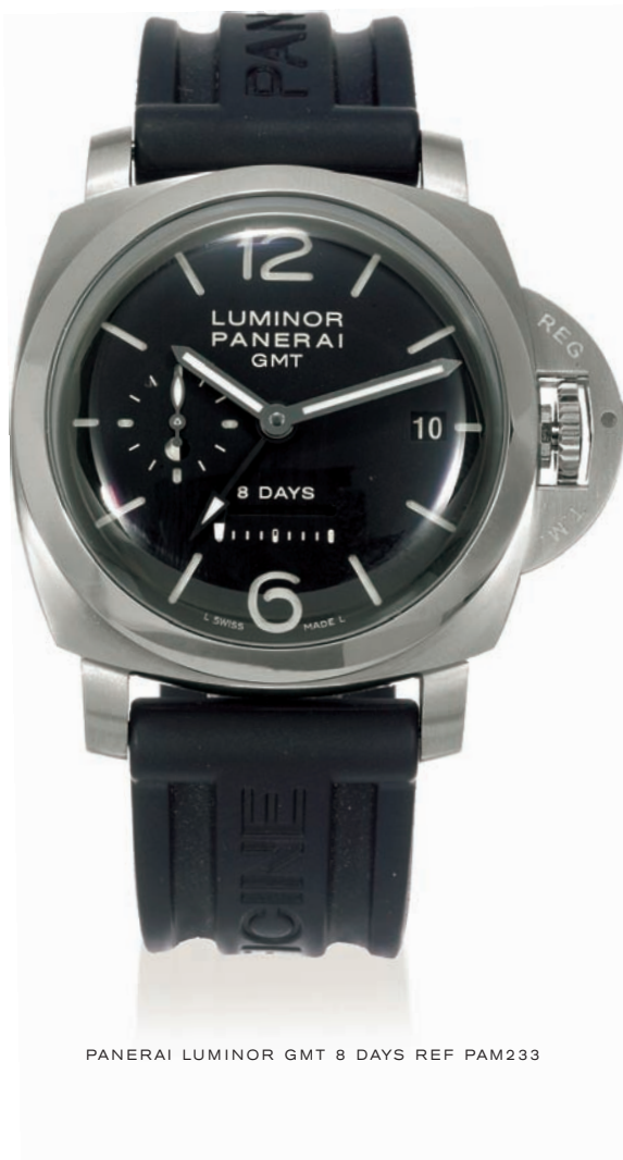
PANERAI LUMINOR GMT 8 DAYS REF PAM233