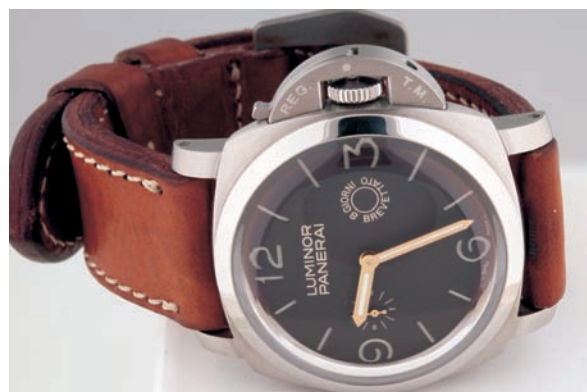
PANERAI LUMINOR REF PAM203

NEL 1997 LA PANERAI CEDETTE IL RAMO OROLOGI AL GRUPPO CARTIER MEGLIO CONOSCIUTO VENDÔME LUXURY GRUOP, LE SERIE PRECEDENTI A QUESTA DATA SONO DEFINITE APPUNTO PRE VENDOME, PER PANERAI QUESTA DATA E' UNO SPARTIACQUE, IL GRUPPO VENDOME HA LA POSSIBILITÀ DI LANCIARE IL PROPRIO PRODOTTO SU SCALA MONDIALE E COSÌ SARÀ